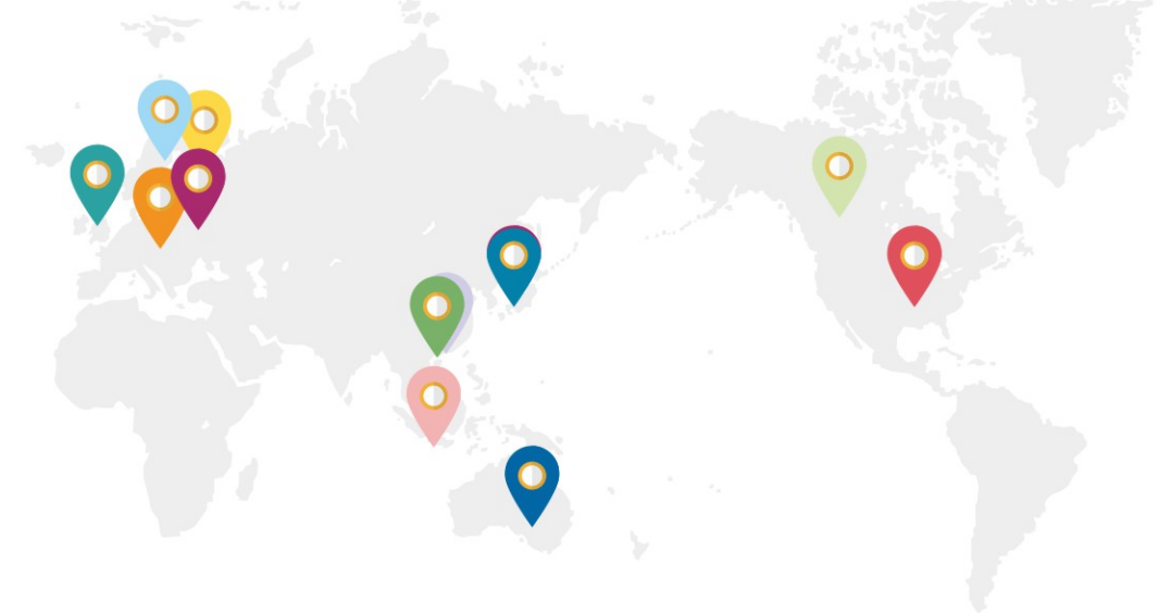
2023届毕业生出国（境）拟深造国家（地区）分布图

经统计，电子科技大学格拉斯哥学院毕业后继续深造的本科生遍布全球11个国家和地区，主要以新加坡、美国、英国和中国香港为主，其次为英国和澳大利亚。