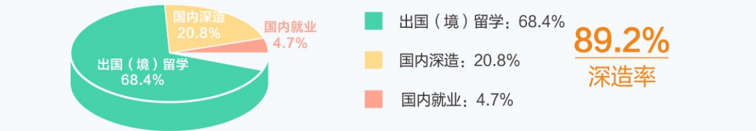
2023届毕业生毕业去向分布图数据 (截止2023年5月29日)

学院2023届毕业生国内外读研深造率达89.2%（截止2023年5月29日） 68.4%的学生选择海外深造，人均获得3.2个offer，多名学生被斯坦福大学、牛津大学、剑桥大学、宾夕法尼亚大学、洛桑联邦理工学院、康奈尔大学、哥伦比亚大学、加州大学伯克利分校、帝国理工学院、伦敦大学学院、爱丁堡大学、格拉斯哥大学、香港大学、香港科技大学、新加坡国立大学、新加坡南洋理工大学等世界名校录取。20.8%的学生选择国内深造，多名学生赴北京大学、清华大学、上海交通大学、复旦大学、中国科学院大学等名校深造。18人选择在国内外直博深造，多名学生被新加坡国立大学、伦敦大学国王学院、宾夕法尼亚大学、加州大学洛杉矶分校、香港科技大学、格拉斯哥大学、清华大学、北京大学、复旦大学、上海交通大学等名校录取。就业学生受到世界500强企业的青睐。